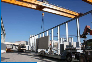
Remorque Intra site