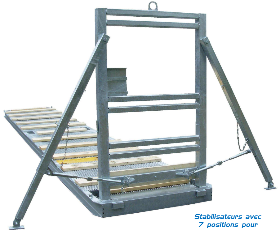
Stabilisateurs avec 7 positions pour meilleure stabilité sur sols accidentés