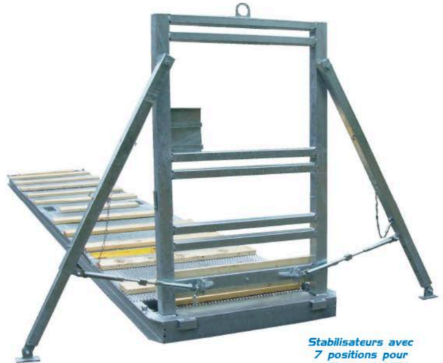
Stabilisateurs avec 7 positions pour meilleure stabilité sur sols accidentés