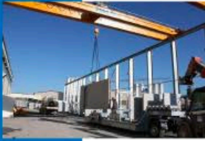
Remorque Intra site