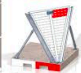
Module d'angle « V »