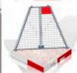
Module d'angle « A »

CONTACT DIRECTEUR DEPARTEMENT MANUTENTION MICHEL BOUTINEAU Mobile +33(0)7 86 12 43 52 michel.boutineau@groupe-cartel.com