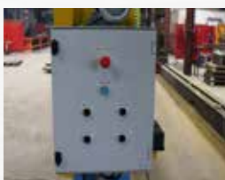
Commande centralisée sur boîtier électrique.