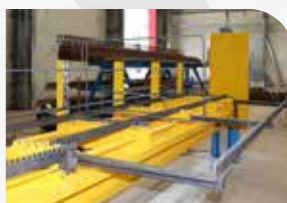
De multiples réglages possibles en fonction du besoin.